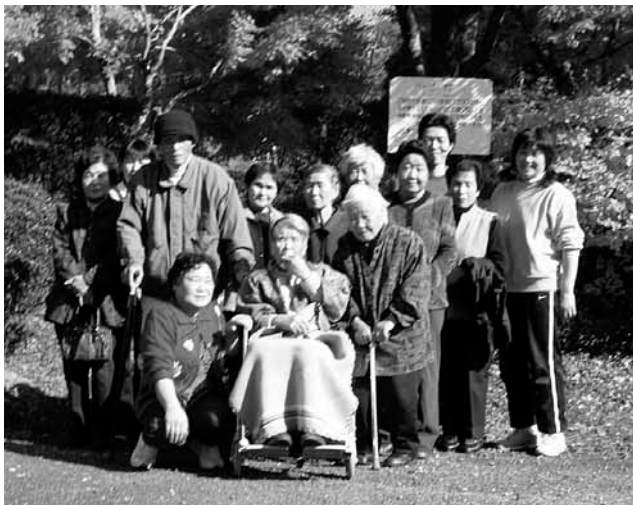
見事な紅葉の前でにっこり

次に、ご紹介するスポットは11月中旬に行ったふるさと旅行村の紅葉です。何本もの、もみじ・銅山ツツジが色付いており、観光客がお弁当を広げている姿も見られました。台風の影響も無く、今年の紅葉は格別でした。このように、久万高原町で生活しながらまだ知らない見事な場所がたくさんあります。利用者さんと発見し、皆さんにもご紹介していきたいと思います。又、隠れた