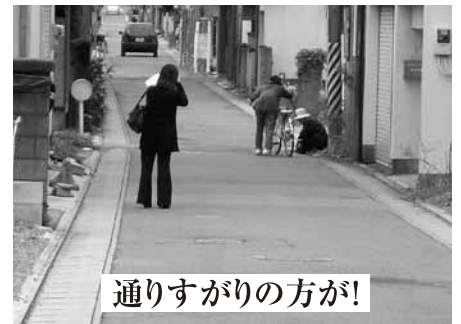
通りすがりの方が!

声かけをして下さった方々に、お話を聞いてみると、「何か様子が違ったから…、声をかけてみたんです…。」とお話をされる。