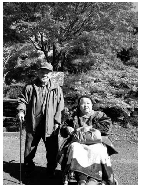
ご夫婦ながよくにっこり

先ず、6月に出かけた東川増進センター前アジサイです。地元の方々が丹精込めて管理されているアジサイは実に見事でデイの利用者も大変感動されておりました。