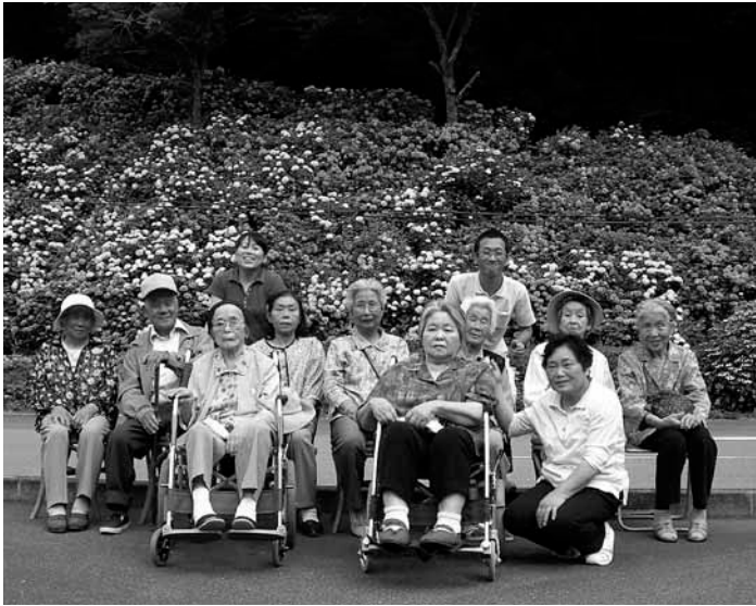
アジサイの前でハイポーズ

次に、ご紹介するスポットは11月中旬に行ったふるさと旅行村の紅葉です。何本もの、もみじ・銅山ツツジが色付いており、観光客がお弁当を広げている姿も見られました。台風の影響も無く、今年の紅葉は格別でした。このように、久万高原町で生活しながらまだ知らない見事な場所がたくさんあります。利用者さんと発見し、皆さんにもご紹介していきたいと思います。又、隠れた