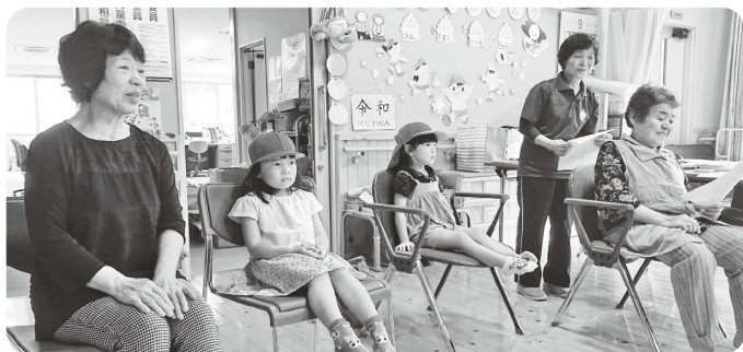
噂を聞きつけてかわいいお客様たちも参加