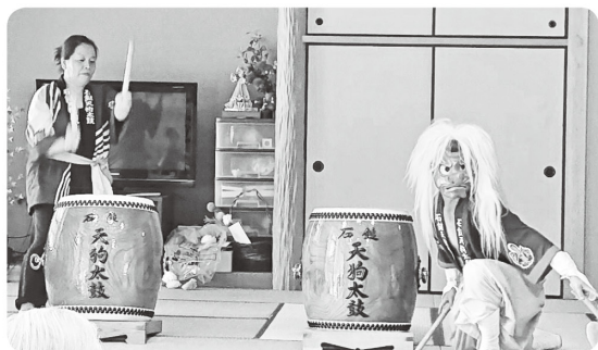
面河石鎚天狗太鼓