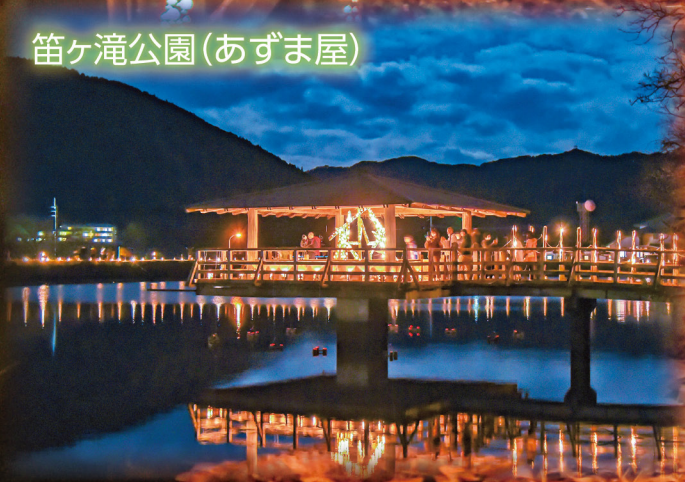
笛ヶ滝公園(あずま屋)