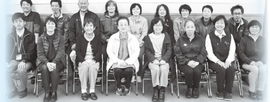
住民主体型サービス・基準緩和型サービス従事者研修