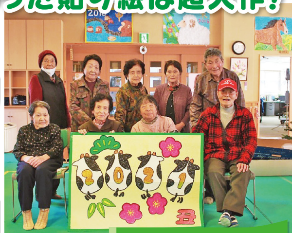
面河デイサービス