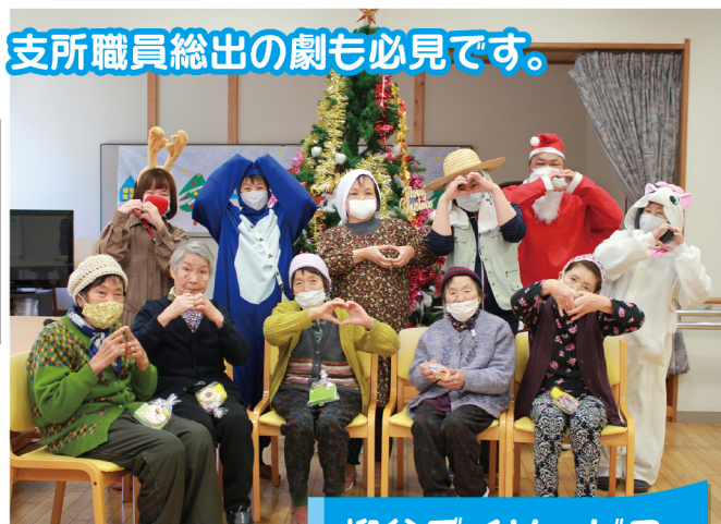
柳谷デイサービス