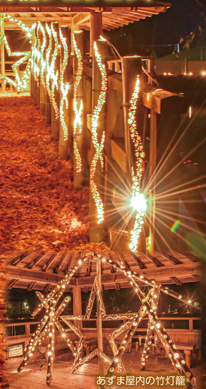
あずま屋内の竹灯籠