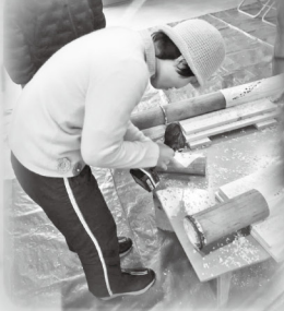
竹灯籠作りの作業風景