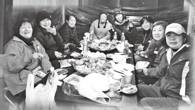
女性部「少女隊」のみなさんです。作成作業中は「全集中、竹の呼吸」で頑張っていました♪