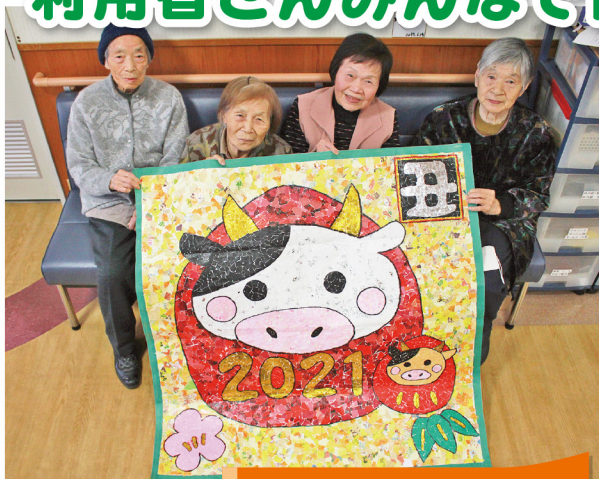
美川デイサービス