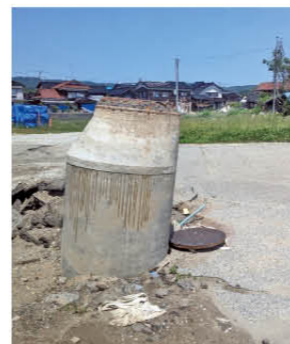
浮き上がったマンホール

私が派遣された石川県珠洲市(すずし)は、全壊・半壊家屋が多く、ほとんどの家庭がいまだに断水していました。道路の亀裂や土砂崩れでまだ通れないところもあり、被害の大きさを感しました。マンホールが浮き上がっているのに驚きました。