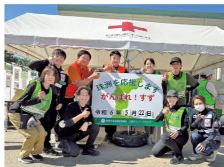
また絶対に行くからね!

私の主な業務は被災世帯の現地調査でした。必要な作業内容などを確認するだけでなく、被災者の悩みや不安に耳を傾けるなど、心のケアが大切だと感じました。珠洲市も久万高原町と同じく高齢者が多く、助けが必要でも「人に頼るのは気の毒」と考えて声を上げない人も多いため、他にボランティアが必要な場所がないか、丁寧な聞き取りを心掛けました。