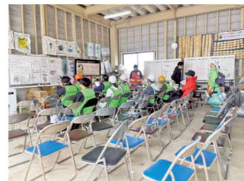
災害ボランティアセンターの様子

私の主な業務は被災世帯の現地調査でした。必要な作業内容などを確認するだけでなく、被災者の悩みや不安に耳を傾けるなど、心のケアが大切だと感じました。珠洲市も久万高原町と同じく高齢者が多く、助けが必要でも「人に頼るのは気の毒」と考えて声を上げない人も多いため、他にボランティアが必要な場所がないか、丁寧な聞き取りを心掛けました。