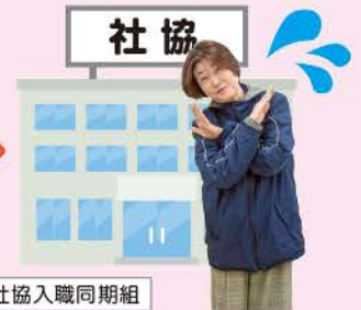
モデル：いつも仲良し社協入職同期組