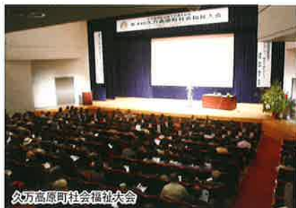
久万高原町社会福祉大会

福祉大会を実施しない年は、福祉フェスティバルを開催し、各関係機関・団体等との交流・連携を深めています。