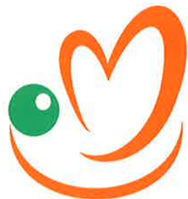
愛媛県下の 社会福祉協議会 シンボルマーク