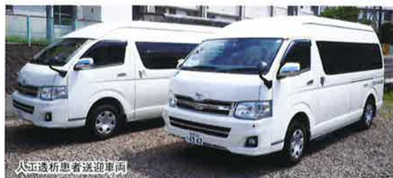
人工透析患者送迎車両

じん臓機能障がいにより人工透析療を受けている方に対し、経済的負担の軽減と利用者の福祉の向上を図ることを目的として、通院のための送迎サービスを実施します。