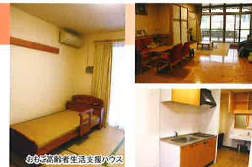
おもご高齢者生活支援ハウス

ひとりで生活するには不安のある人に、住まい・生活相談・緊急時の対応・地域住民との交流などのサービスを提供する高齢者向けの福祉施設を、指定管理者として運営しています。